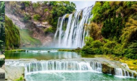
น้ำตกหวงท้าวซู