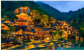
จูเจียงจ้าย