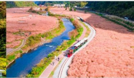
นั่งรถไฟชมทุ่งหญ้าชมพู

*ทางบริษัทฯ ขอสงวนสิทธิ์ในการสลับโปรแกรมทัวร์ตามความเหมาะสมขึ้นอยู่กับสถานการณ์หน้างาน โดยคำนึงถึงผลประโยชน์ของลูกค้าเป็นสำคัญ