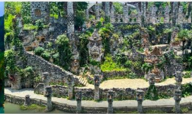
ปราสาทหินเย่หลางกู่