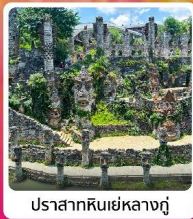
ปราสาทหินยี่หลางกู่