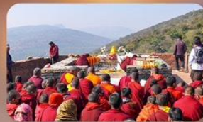
เชาคิชนกูฏ