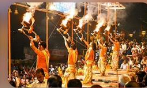
พิริคคคา อารตี