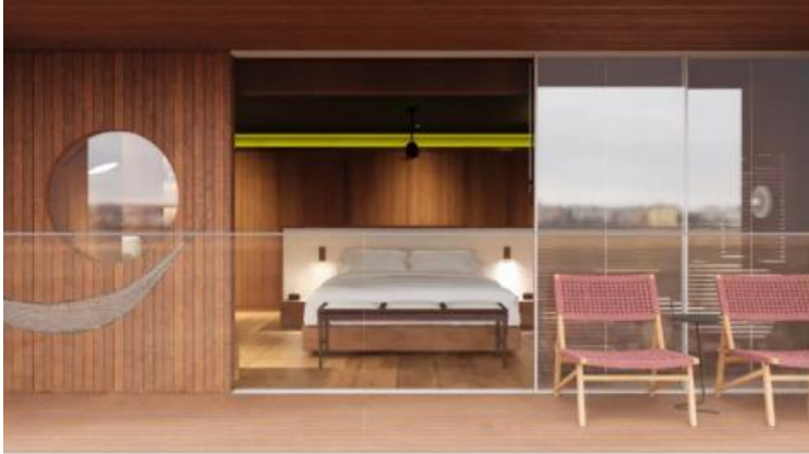
DECK 4 CANOPEE SUITE