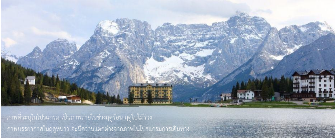
ภาพที่ระบุในโปรแกรม เป็นภาพถ่ายในช่วงฤดูร้อน-ฤดูใบไม้ร่วง ภาพบรรยากาศในฤดูหนาว จะมีความแตกต่างจากภาพในโปรแกรมการเดินทาง