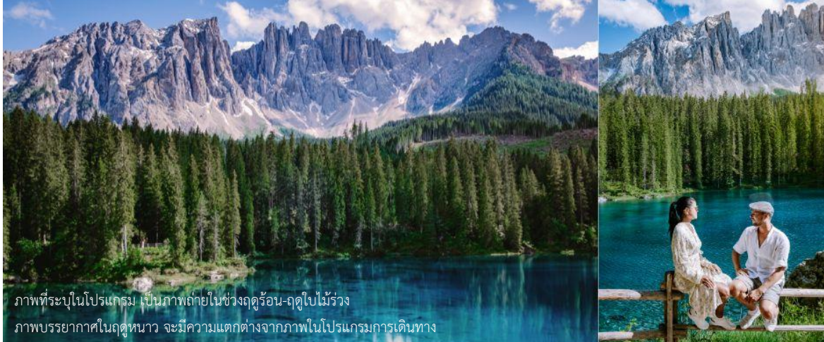
ภาพที่ระบุในโปรแกรม เป็นภาพถ่ายในช่วงฤดูร้อน-ฤดูใบไม้ร่วง ภาพบรรยากาศในฤดูหนาว จะมีความแตกต่างจากภาพในโปรแกรมการเดินทาง

มองเห็นได้อย่างชัดเจนจากทุกมุมมอง ท่านจะได้ชมความงามของภูเขา Dolomites ซึ่งได้รับการขึ้นทะเบียนเป็นมรดกโลกจากยูเนสโก ถึงเวลาอันสมควรนำท่านเดินทางกลับลงมาที่ตัวเมืองออดิเซ่