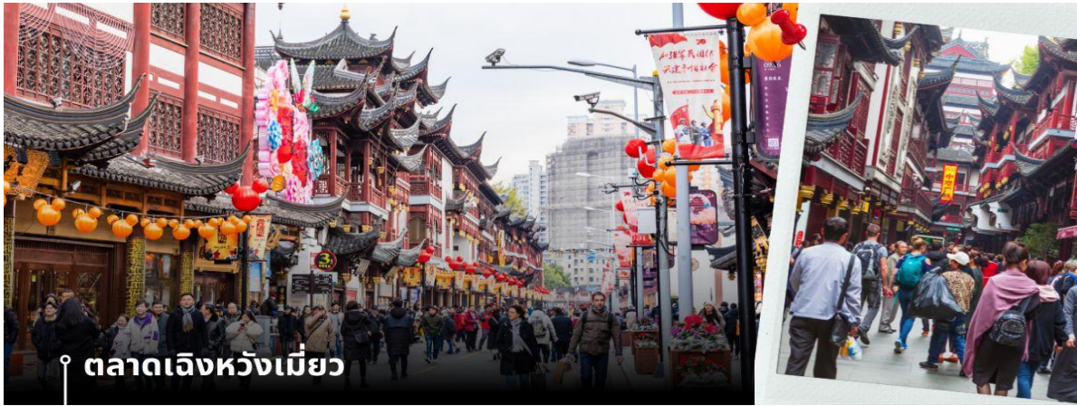
📍 ตลาดเจิ้งเหมียว

จากนั้นนำท่านสู่ ตลาดเจิ้งเหมียว เป็นศูนย์รวมสินค้า และอาหารพื้นเมืองที่แสดงถึงเอกลักษณ์ของชาวเซี่ยงไฮ้ซึ่งมีการผสมผสานระหว่างอดีตและปัจจุบันได้อย่างลงตัว ซึ่งเป็นย่านสินค้าราคาถูกที่มีชื่อเสียงย่านหนึ่งของนครเซี่ยงไฮ้ให้ท่านอิสระช้อปปิ้งตามอัธยาศัย