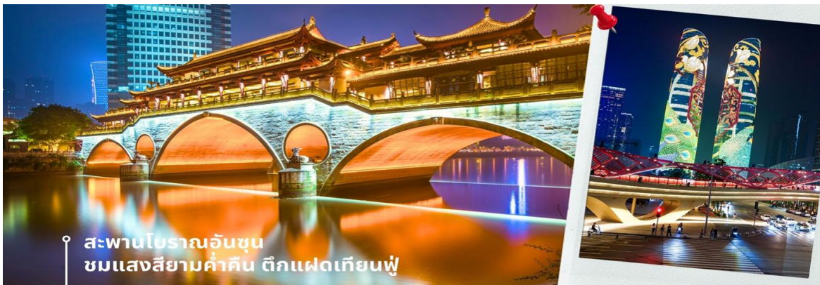
สะพานโบราณอันชุน ชมแสงสียามค่ำคืน ตึกแฝดเทียนฟู

นำท่านชม สะพานโบราณอันชุน-พร้อมชมแสงสียามค่ำคืน ตึกแฝดเทียนฟู เป็นสะพานข้ามคลองที่สร้างเป็นเหมือนอาคารอยู่ข้างบน ในช่วงเวลายามเย็นจะเป็นช่วงที่ผู้คนออกมาชมบรรยากาศบริเวณของสะพานแห่งนี้ และมีร้านค้ามากมาย รวมไปถึงบาร์เครื่องดื่มต่างๆ ที่ดึงดูดนักท่องเที่ยวได้เป็นอย่างดี เป็นสะพานที่ทอดข้ามแม่น้ำจินเจียง และเป็นรูปแบบสะพานมีหลังคา ตามลักษณะสถาปัตยกรรมจีนโบราณ อายุมากกว่า 300 ปี และในบริเวณใกล้เคียงกัน ยังเป็นที่ตั้งของ ตึกแฝดเทียนฟู โดยในช่วงค่ำเวลา ประมาณ 19.00-22.00 น. ทั้ง 2 ตึกจะเป็นไฟ LED สวยงามโดดเด่นมาก ตึกแฝดเทียนฟู หรือที่เรียกอย่างเป็นทางการว่าตึกศูนย์การเงินนานาชาติเทียนฟู เป็นตึกระฟ้าที่สวยงามโดดเด่นสองตึกในย่านการเงินของเจิงตู ตึกแต่ละตึกมีความสูง 58 ชั้นและสูงกว่า 700 ฟุต ตึกเหล่านี้โดดเด่นเป็นพิเศษด้วยภายนอกที่หุ้มด้วยไฟ LED ที่เป็นเอกลักษณ์ ซึ่งเปลี่ยนอาคารให้กลายเป็นจอภาพดิจิทัลขนาดใหญ่