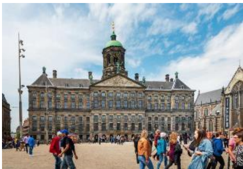
ค่า อิสระอาหารค่ำตามอัธยาศัย

นำท่านเดินเที่ยวชมและเลือกซื้อสินค้าที่บริเวณ จัตุรัสดัมสแควร์ (Dam Square) หรือ จัตุรัสตาม เป็นสัญลักษณ์ของอัมสเตอร์ดัมที่เต็มไปด้วยกลิ่นอายของประวัติศาสตร์ และยังเป็นที่ตั้งของพระราชวังหลวง Royal Palace โดยเป็นที่ตั้งของอนุสาวรีย์แห่งชาติเพื่อเป็นการระลึกถึงผู้ที่ตกเป็นเหยื่อของสงครามโลกครั้งที่ 2 และเป็นย่านที่รายล้อมไปด้วยอาคารเก่าแก่ ศูนย์รวมห้างสรรพสินค้า ร้านอาหาร และคาเฟ่ ทั้งยังเป็นสถานที่รวมตัวอันมีชีวิตชีวาไม่ว่าในโอกาสงานเฉลิมฉลองหรือการประท้วงต่างๆ สิ่งที่ไม่ควรพลาดชมเมื่อดัมสแควร์ คือ แพนทินสีขาวซึ่งเป็นอนุสาวรีย์แห่งชาติที่สร้างขึ้นในปี ค.ศ. 1956 เพื่อระลึกถึงทหารผ่านศึกจากสงครามโลกครั้งที่ 2 นอกจากนี้ยังมีห้าง de Bijenkorf เป็นห้างที่ตั้งอยู่บริเวณดัมสแควร์และเป็นห้างใหญ่ที่สุดในอัมสเตอร์ดัม ท่านสามารถเลือกซื้อและเลือกชมสินค้าแบรนด์เนม อาทิ Louis Vuitton, Balenciaga, Stella McCartney และอีกหลากหลายแบรนด์ รวมถึงเครื่องสำอาง เสื้อผ้ารองเท้า หรือขนม ของฝาก อิสระให้ท่านช้อปปิ้งตามอัธยาศัย หลังจากนั้นนำท่านให้เวลาท่านเดินเล่นอิสระ ย่าน Red light district หรือย่านโคมแดง โดยชาวต่างชาติจะเรียกย่านนี้ว่าเดอวัลเลน ตั้งอยู่ใจกลางกรุงอัมสเตอร์ดัม เป็นย่านการค้าเพศพาณิชย์ที่ถูกกฎหมาย โดยสถานที่นี้ยังเป็นที่ตั้งของ Red Light Secrets ซึ่งเป็นพิพิธภัณฑ์เกี่ยวกับการค้าประเวณีซึ่งภายในจะมีการอธิบายเกี่ยวกับอาชีพโสเภณี ซึ่งถือว่าเป็นอาชีพที่เก่าแก่ที่สุดในโลกนี้นอกจากนี้แล้วเดอวัลเลนก็ยังเป็นย่านที่พิกาศัยปกติธรรมดาของคนเนเธอร์แลนด์ มีทั้งร้านค้าเล็กๆ และคาเฟ่เก่าๆ และยังมีโรงเรียนอนุบาลตั้งอยู่ใกล้ๆ ตูกระจกของโสเภณีด้วย