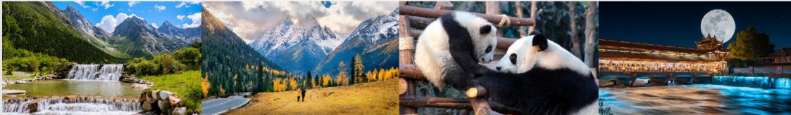
อุทยานแห่งชาติปี่เฟิงโกว