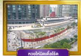
หอยไทม์เคิลโรด