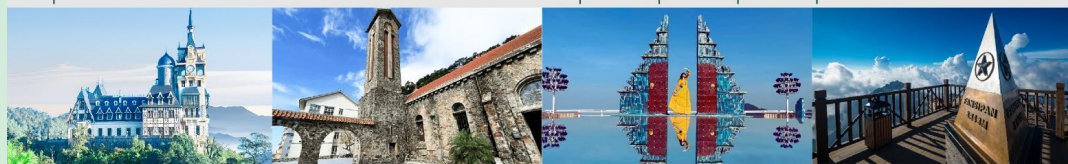
ปราสาทตามด้าว โบสถ์หินตามด้าว Cau may ฟานซิปิน

*ทางบริษัทฯ ขอสงวนสิทธิ์ในการสลับโปรแกรมทัวร์ตามความเหมาะสมขึ้นอยู่กับสถานการณ์หน้างาน โดยคำนึงถึงผลประโยชน์ของลูกค้าเป็นสำคัญ