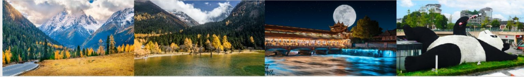
ภูเขาสี่ดรุณี (หุบเขาชวงเฉียวโกว) อุทยานแห่งชาติป่าเผิงโกว สะพานหนานเฉียว รูปปั้นหมีแพนด้าบนเชลฟ์

*ทางบริษัทฯ ขอสงวนสิทธิ์ในการสลับโปรแกรมทัวร์ตามความเหมาะสมขึ้นอยู่กับสถานการณ์หน้างาน โดยคำนึงถึงผลประโยชน์ของลูกค้าเป็นสำคัญ