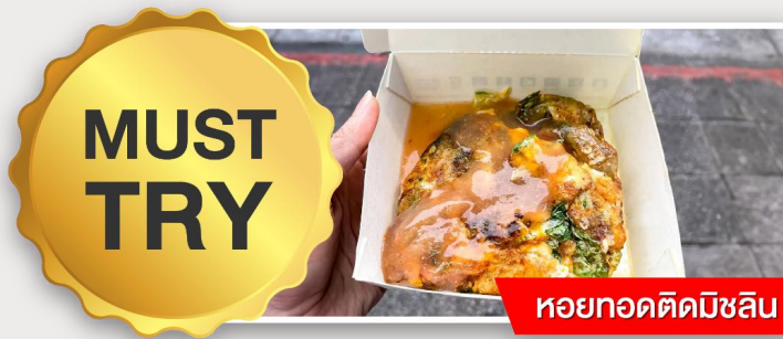
หอยทอดตัดมิชลิน

เย็น อิสระอาหารเย็นตามอัธยาศัย ณ ตลาดกลางคืนหนิงเซีย