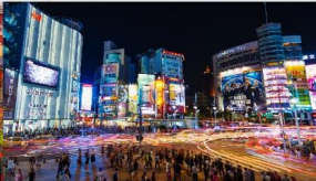
ตลาดกลางคืนซีเหมินติง

*ทางบริษัทฯ ขอสงวนสิทธิ์ในการสลับโปรแกรมทัวร์ตามความเหมาะสมขึ้นอยู่กับสถานการณ์หน้างาน โดยคำนึงถึงผลประโยชน์ของลูกค้าเป็นสำคัญ