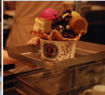
ร้านไอศกรีมมียาฮารา (Miyahara Ice cream)

นำท่านเดินทางสู่ ตลาดกลางคืนอี้จง (Yizhong Street Night Market) ที่มีทั้งร้านอาหาร ของกิน ร้านเสื้อผ้า ร้านรองเท้า รวมไปถึงห้างสรรพสินค้า มีแต่ของกินของช้อปปิ้งที่ได้วันเเยะเเยะมากมาย ให้ท่านได้เลือกซื้อเลือกชื้อกันได้ตามอัธยาศัย