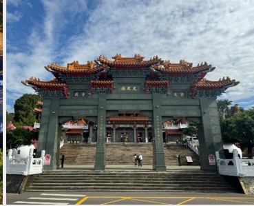
วัดเหวินอู่ (Wenwu Temple)

นำท่าน ท่องเรือทะเลสาบสุริยันจันทรา (Sun Moon Lake) ทะเลสาบน้ำจืดที่ใหญ่ที่สุดในไต้หวัน ตั้งอยู่ในเมืองหยูซี มณฑลหนานโถว ทางตอนกลางของเกาะไต้หวัน ตั้งอยู่สูงเหนือกว่าระดับน้ำทะเล ประมาณ 748 เมตร มีพื้นที่ทั้งหมดกว่า 5.4 ตารางกิโลเมตร ล้อมรอบไปด้วยเทือกเขาสูงใหญ่ มีความสูงตั้งแต่ 600 - 2,000 เมตร สลับกันไปจนเกิดเป็นวิวทิวเขาที่สวยงาม จนได้รับการขนานนามว่าเป็น “สวิสเซอร์แลนด์แห่งไต้หวัน” จุดเด่นคือพื้นน้ำสีฟ้าอมเขียวส่องประกายอย่างสวยงาม เมื่อมองในมุมสูง ทางด้านฝั่งตะวันออกมีลักษณะคล้ายกับพระอาทิตย์ และทางด้านตะวันตกจะคล้ายกับพระจันทร์เสี้ยว โดยมีเกาะลาถู เป็นตัวแบ่งอาณาเขตอยู่ตรงกลาง จนกลายเป็นที่มาของชื่อ ทะเลสาบสุริยันจันทรา นอกจากนี้ทิวทัศน์ธรรมชาติที่สวยงามแล้ว บริเวณรอบๆ ทะเลสาบยังรายล้อมไปด้วยวัด