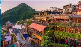
ถนนโบราณจิวเฟิ่น