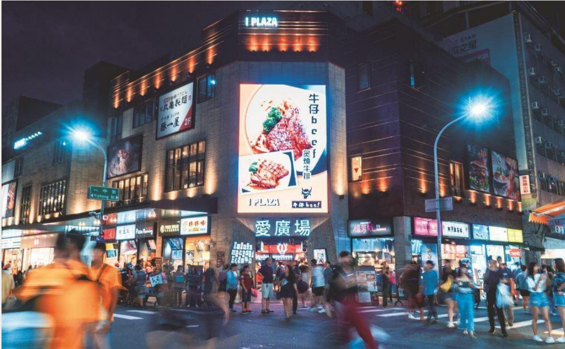
ตลาดกลางคืนอี้จิง (Yizhong Street Night Market)

เย็น อิสระอาหารเย็นตามอัธยาศัย ณ ตลาดกลางคืนอี้จิง