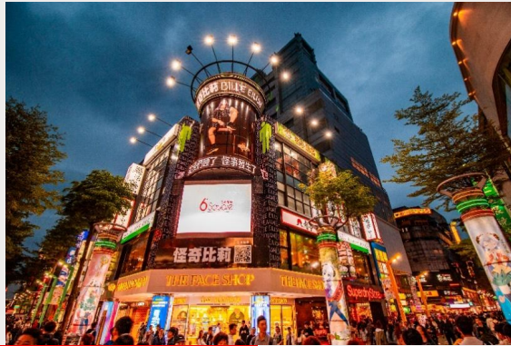
ตลาดกลางคืนซีเหมินติง (Ximending Night Market)

เย็น อิสระอาหารเย็นตามอัธยาศัย ณ ตลาดกลางคืนซีเหมินติง