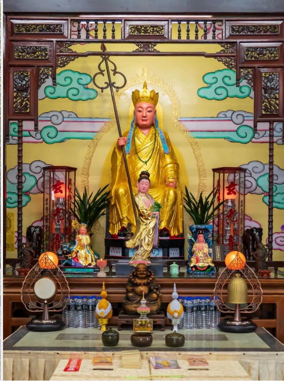
วัดพระถังซำจั๋ง (Xuanguang Temple)

นำท่านเดินทางสู่ กรุงไทเป (TAIPEI CITY) เมืองหลวงของไต้หวัน ศูนย์กลางทางการเมือง การปกครอง เศรษฐกิจ การค้า และวัฒนธรรมที่หลากหลาย มีประชากรประมาณ 2.6 ล้านคน กรุงไทเปถูกสร้างขึ้นตั้งแต่ปลายศตวรรษที่ 19 สมัยราชวงศ์ชิง มีอายุกว่า 130 ปีมาแล้ว แต่ยังคงรักษาไว้ซึ่งวัฒนธรรมอันเก่าแก่ อย่างเช่น โบราณสถาน ถนนสายเก่า และวัดวาอาราม ที่มีคุณค่าทางประวัติศาสตร์อยู่มากมาย ปัจจุบันไทเปเป็นหนึ่งในเมืองขนาดใหญ่ในทวีปเอเชียที่มีย่านการค้าที่มีชื่อเสียง มีอาหารนานาชาติ บรรยากาศยามค่ำคืนที่คึกคัก และระบบคมนาคมขนส่งสาธารณะที่มีประสิทธิภาพ รวมถึงเป็นที่ตั้งของตึก Taipei 101 ซึ่งเคยเป็นตึกที่สูงที่สุดในโลก และมีสถานที่ท่องเที่ยว ทั้งทางธรรมชาติและวัฒนธรรมอีกมากมาย (ใช้เวลาเดินทางประมาณ 3 ชั่วโมง 30 นาที)