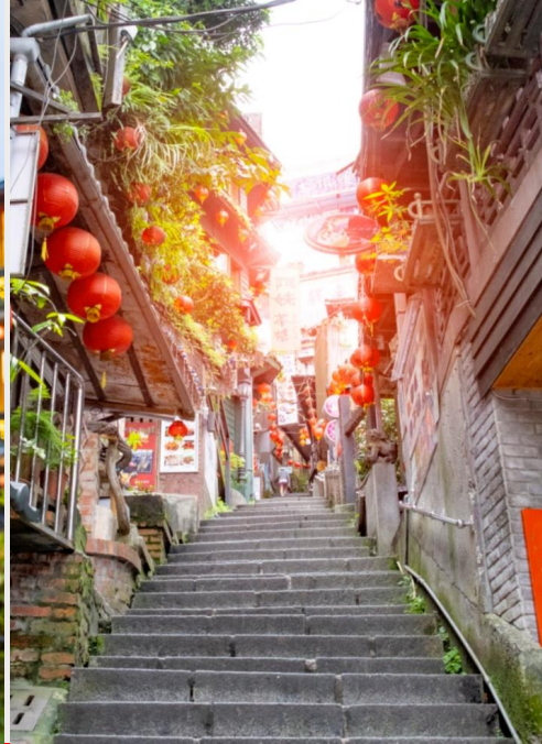
ถนนโบราณจีวเฟิน (Jiufen Old Street)