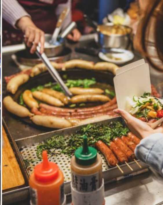
ตลาดกลางคืนหนิงเซีย (Ningxia Night Market)

เย็น อิสระอาหารเย็นตามอัธยาศัย ณ ตลาดกลางคืนหนิงเซีย