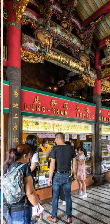
วัดหลงซาน (Longshan Temple)

กลางวัน บริการอาหารกลางวัน ณ ภัตตาคาร (เมนูพิเศษ บุฟเฟ่ต์ชาบู)