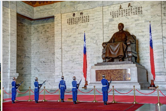
อนุสรณ์สถานเจียงไคเช็ค (Chiang Kai-Shek Memorial Hall)

จากนั้นนำท่านถ่ายรูปกับ ตึกไทเป 101 (Taipei 101) ตึกระฟ้าที่สูงที่สุดในไต้หวัน และเคยเป็นตึกที่สูงที่สุดในโลกในปี ค.ศ. 2004 ความสูงจากพื้นดิน 509.2 เมตร มีทั้งหมด 101 ชั้น ชั้น 1-5 จะเป็นส่วนของห้องสรรพสินค้าและร้านอาหารต่างๆ โดยมีสินค้ามากมายให้ท่านเลือกซื้อป ทั้งสินค้าทั่วไป