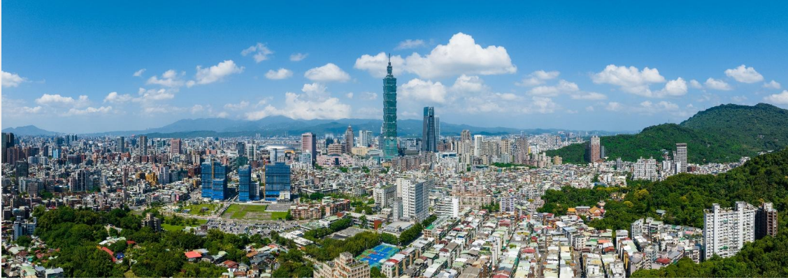
กรุงไทเป (TAIPEI CITY)

จากนั้นนำท่านสู่ ตลาดกลางคืนหนิงเซีย (Ningxia Night Market) หรือที่รู้จักกันในชื่อ “กะเพราะไทเป” ที่นี่เป็นตลาดกลางคืนที่มีอายุเก่าแก่ มีมาตั้งแต่สมัยสงครามโลกครั้งที่ 2 เต็มไปด้วยร้านอาหารแนวสตรีทฟู้ดเจ้าเด็ด โดยเมนูที่ห้ามพลาด คือ เผือกทอดไข่เค็มที่อร่อยระดับมิชลิน ชูปด๊ับรสชาติเข้มข้น ไก่ผัดซีอิ้วหอมๆ รสชาติละมุน และอีกมากมาย