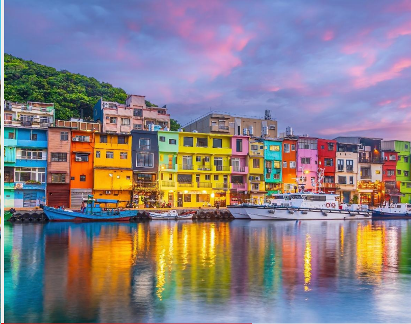
ท่าเรือประมงเจิ้งปิน (Zhengbin Fishing Port)

จากนั้นนำท่านเดินทางสู่ ถนนโบราณจิ่วเฟิ่น (Jiufen Old Street) ตั้งอยู่บนเขา ทิวทัศน์ภาพสวยงาม ด้านหลังเป็นภูเขา ด้านหน้าเป็นวิวทะเลจีหลง แต่เดิมเคยเป็นหมู่บ้านเล็กๆ ที่โอบล้อมด้วยทิวเขา และมองเห็นท้องทะเลอยู่ลิบๆ หมู่บ้านแห่งนี้อดีตเคยเป็นเมืองทองคำที่มีชื่อเสียงตั้งแต่สมัยกษัตริย์กวางสวี่ แห่งราชวงศ์ชิง โดยตั้งแต่ช่วงปี ค.ศ. 1890 ได้มีการสำรวจพบแร่ทองคำ ญี่ปุ่นที่ เป็นผู้ครอบครองได้หวั่นขณะนั้น ได้เนรมิตให้ที่นี่เป็นเมืองทอง โดยใช้แรงงานหลักคือเชลยศึก ซึ่งนำมาซึ่งความมั่งคั่งและคึกคักให้กับเมือง แต่เมื่อแร่ทองคำร่อยหรอ จนบริษัทเอกชนของไต้หวันที่มาจับช่วงต่อ ในช่วงปี ค.ศ. 1987 ต้องประสบภาวะขาดทุนจนต้องปิดกิจการไปในที่สุด จนเป็นแรงบันดาลใจให้ผู้สร้างของญี่ปุ่นอย่างสตูดิโอจิบลิ ได้ใช้เป็นฉากหลังของหนังการ์ตูนที่โด่งดังจนคว้ารางวัลออสการ์มาครองในปี 2002 กับเรื่อง “SPIRIT AWAY” นอกจากนี้ภายในหมู่บ้านที่เต็มไปด้วยอาคารโบราณย้อนยุคอันเป็นเสน่ห์หลักของเมืองนี้ ทั้งสองข้างทาง มีสินค้าขายอยู่มากมาย ไม่ว่าจะเป็น ของที่ระลึก อาหารท้องถิ่น ชุดเสื้อผ้าที่เพ้า ร้านอาหาร เป็นต้น (โดยสารรถประจำทางขึ้นไป)