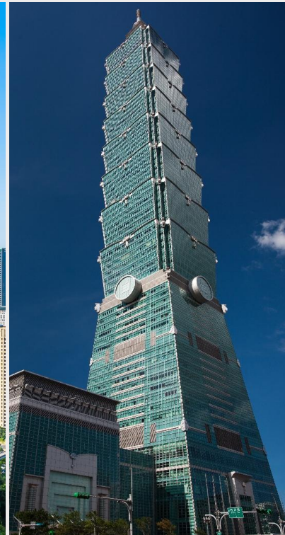
ตึกไทเป 101 (Taipei 101)