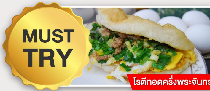
โรตีกอดครึ่งพระจันทร์

เย็น อิสระอาหารเย็นตามอัธยาศัย ณ ตลาดกลางคืนอี้จิง