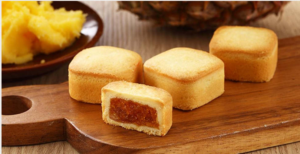
ร้านขนมพายสับปะรด (Taiwanese Pineapple Cake)

นำทุกท่านแวะชิม ร้านขนมพายสับปะรด (Taiwanese Pineapple Cake) ขนมที่ถือได้ว่ามีแหล่งกำเนิดมาจากเกาะไต้หวัน เนื้อแป้งหอมเนยหอมชุ่มแยมสับปะรด รสชาติมีความหวาน และความมันของเนยเล็กน้อย ผสมกับรสเปรี้ยวของสับปะรด ทำให้มีรสชาติที่กลมกล่อมจนเป็นที่นิยม ด้วยรสชาติที่เป็นเอกลักษณ์ไม่เหมือนใคร ทำให้ขนมพายสับปะรดเป็นขนมที่ขึ้นชื่อของเกาะไต้หวัน ไม่ว่าจะใครที่ได้มาเยือนก็ต้องซื้อเป็นของฝากติดมือกลับบ้าน นอกจากขนมพายสับปะรดแล้ว ยังมีขนมอีกมากมายให้เลือกชิม และเลือกซื้อ เช่น ขนมพระอาทิตย์ ขนมพายเผือก เป็นต้น อิสระให้ทุกท่านเดินเลือกซื้อขนม