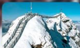
พิชิต 3 ยอดเขาคิง Rigi / Schilthorn / Glacier 3000