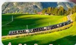
นั้งรถไฟสายโรเมนดิก 2 สาย Golden Pass / Luzern Interlaken Express