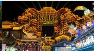
ตีทมัสจอร์ยี 72