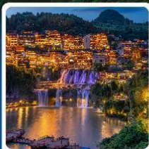
ฝูรงเจิน