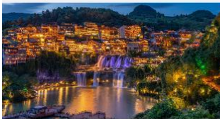
หมู่บ้านโบราณฟูหรงเจิน