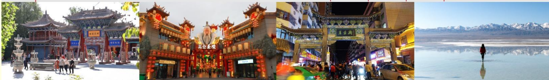
วัดพระใหญ่จางเย่