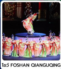
โชว์ FOSHAN QIANGUCING