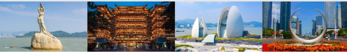
จูไห่พีชเชอร์เกิร์ล(หัวหิน)