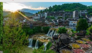
หมู่บ้านโบราณฝูหรงเจิน

*ทางบริษัทฯ ขอสงวนสิทธิ์ในการสลับโปรแกรมทัวร์ตามความเหมาะสมขึ้นอยู่กับสถานการณ์หน้างาน โดยคำนึงถึงผลประโยชน์ของลูกค้าเป็นสำคัญ