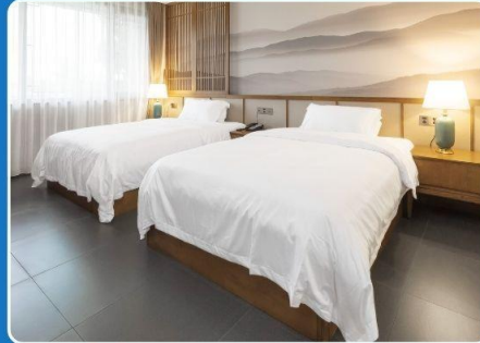
👤👤 TWIN (TWN)