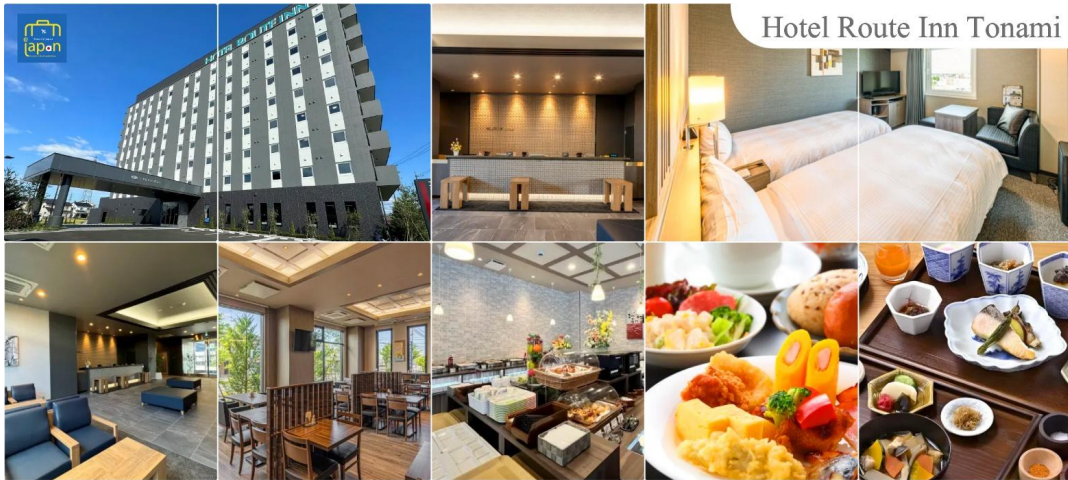
Hotel Route Inn Tonami

ที่พัก HOTEL ROUTE INN TONAMI หรือเทียบเท่าระดับเดียวกัน