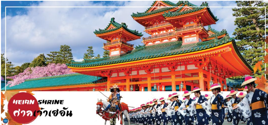
HEIAN SHRINE ศาลเจ้าเฮอัน

วันที่ห้า เมืองนาโกย่า – เมืองเกียวโต – ศาลเจ้าเฮอัน – การเรียนพิธีชงชาญี่ปุ่น – เมืองโอซาก้า – ศาลเจ้านัมมะยาซากะ – ช้อปปิ้งชินไซบาชิ