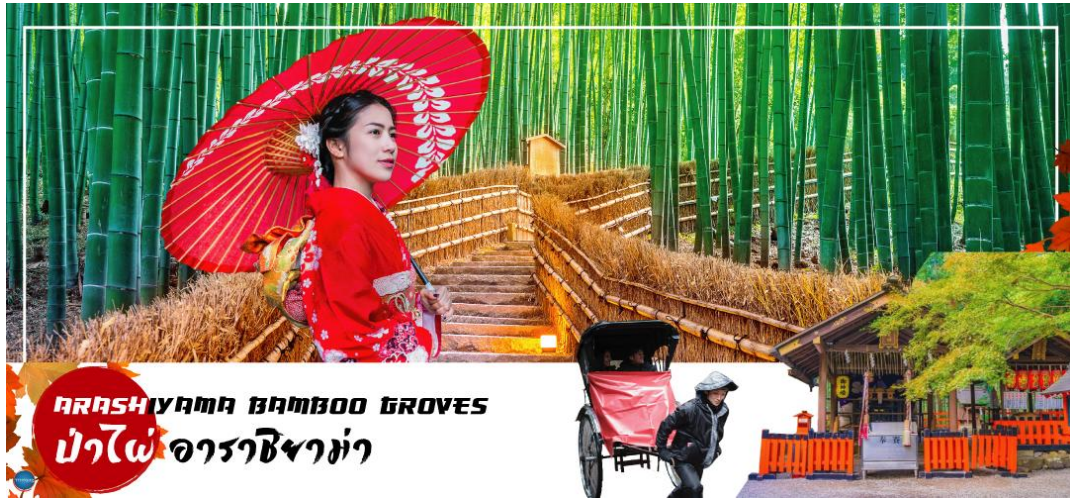
อาราชิยาม่า Bamboo Groves ป่าไผ่ อาราชิยาม่า

วันที่สอง ทำอากาศยานนานาชาติคันไซ โอซาก้า – เมืองเกียวโต – อาราชิยาม่า – สวนป่าไผ่ – สะพานโทเกดส์เคียว – เมืองโทนามิ