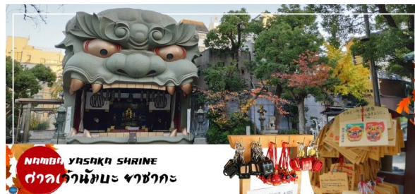
NAMBA YASAKA SHRINE ศาลเจ้านัมมะ ยาซากะ

นำทุกท่านเช็คอินจุดถ่ายรูปที่ ศาลเจ้านัมมะยาซากะ (Namba Yasaka Shrine) ในย่านนัมมะของเมืองโอซาก้า ไฮไลท์ของศาลเจ้าแห่งนี้ คือรูปปั้นหน้าสิงโตอัปปากขนาดใหญ่ ที่เชื่อกันว่าสามารถกลืนกินปีศาจร้าย หรือ สิ่งไม่ดีทั้งหลาย ให้หายไป และนำพามาซึ่งความโชคดีให้แก่ผู้คน ปัจจุบันนักเรียน นักศึกษา และผู้ประกอบการธุรกิจนั้น นิยมมาขอพรให้ประสบความสำเร็จกันที่นี่ ด้วยความสูง 17 เมตร ความกว้าง 11 เมตรและความลึก 7 เมตร อีสระให้ทุกท่านสักการะ และเก็บภาพที่ ศาลเจ้านัมมะ ยะชะกะ