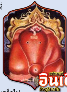
มัทศรรูป อินเดียน อิชฏวินายัก

ในคณศ ปุราณะ ได้กล่าวถึงตำนานเทวสถานแห่งนี้ว่า ในขณะที่ พระพรหม รั้งสรรค์โลกและสรรพสิ่งทั้งหลายอยู่นั้น ครั้งนั้น พระองค์ได้ให้กำเนิดเทวีขึ้น 2 องค์คือ พระนางพุทธิ และ พระนาง ฤทธิ พระองค์ได้ประทานบุตรทั้ง 2 องค์นี้ให้เป็นชายาแก่ พระ คณศ ในเวลานั้น องค์พระหริวิษณุเทพ (พระนารายณ์) อยู่ใน ระหว่างบรรทมสินธุ์ ณ เกษียรสมุทร มุลพระกรรม(หรือขี้หู) ของ พระวิษณุ 2 เม็ดได้ไหลออกมาจากพระกรรม กลายเป็นอสุร 2 ตน คือ มาธูสูร และ ไกตภสูร พวกอสูรได้ก่อกวนองค์พระพรหมจนต้องเสด็จไป พึ่งพระวิษณุ เมื่อทราบเรื่องราวของอสูรแล้วจึงได้เสด็จไปปราบอสูรทั้งสอง แต่ก็ไม่สามารถ กำราบอสูรลงได้ พระองค์จึงเสด็จไปพบบองค์ พระศิวะ เพื่อปรึกษาหนทางที่จะปราบอสูร หลังจากนั้นองค์พระคณศปรากฏต่อพระวิษณุและให้พรในการปราบอสูร พระวิษณุเทพจึงสามารถสังหาร อสูรทั้งสองลงได้สำเร็จ หลังจากนั้นพระวิษณุจึงสร้างเทวสถานขนาดใหญ่ขึ้น เพื่อครอบsvmยุมู มูรติของพระคณศ ณ สถานที่แห่งนี้ที่ทำให้พระองค์มีชัยชนะในสงคราม พระคณศได้ประทาน นามแก่เทวสถานแห่งนี้ว่า "สิทธินายกะ"