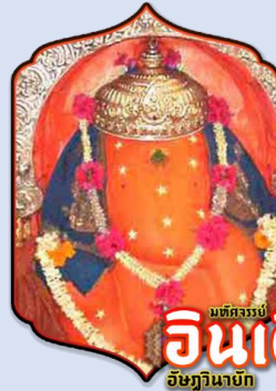
มัทศรรูป อินเดียน อิชฏวินายัก