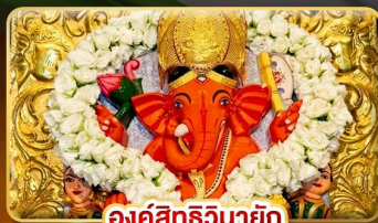
องค์สิทธินายัก