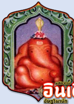
มัทศรรูป อินเดียน อิชฏวินายัก

BT-BOM63_TG_INDIA ASTAVINAYAK แม่หม่อมมิเชลพามู (16-21 SEP 2026)