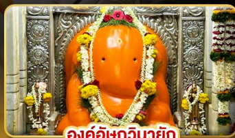
องค์อัฐวินายัก