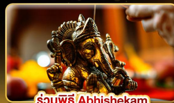
ร่วมพิธี Abhishekam