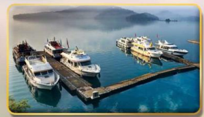
ส่งเรือชมทะเลสาบสุริยันจันทรา