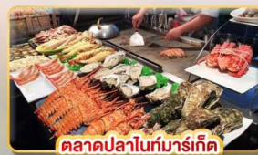
ตลาดปลาไถ่ก๋ามาร์เก็ด