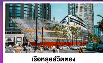
เรือทูลย์สวีตตอง