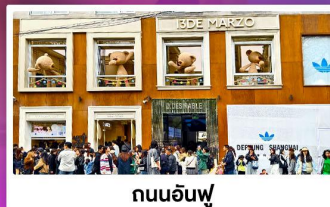
ถนนอ็องฟู