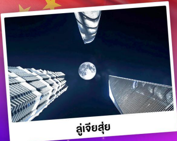
ลู่อัจฉริยะ