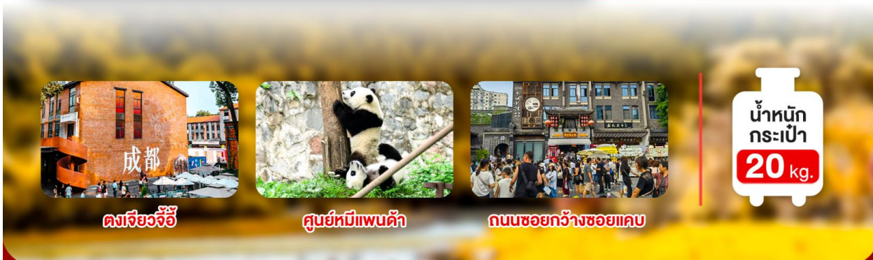
ดงเจียงจี้