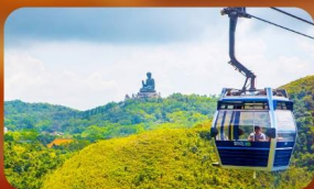
กระเช้าองปิง