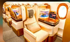
BUSINESS CLASS "บินกลับ"