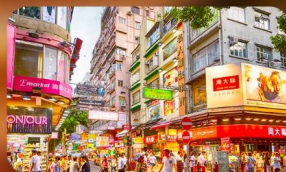
จิมซาจู้