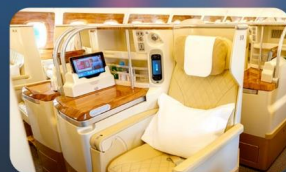
BUSINESS CLASS "บินกลับ"