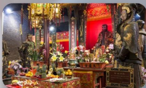
วัดบิกโก