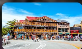
ฟูจิชั้น 5