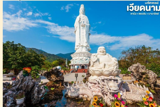
เวียดนาม ดานัง - ฮอยอัน - บานาฮิลล์

นำท่าน สักการะ วัดลินห์อึ้ง (Linh Ung) เป็นวัดที่ใหญ่ที่สุดของเมืองดานังภายในวิหารใหญ่ของวัดเป็นสถานที่บูชาเจ้าแม่กวนอิมและเทพองค์ต่างๆตามความเชื่อของชาวบ้านแถบนี้ นอกจากนี้ยังมีรูปปั้นปูนขาวเจ้าแม่กวนอิมซึ่งมีความสูงถึง 67 เมตรตั้งอยู่บนฐานดอกบัวกว้าง 35 เมตรยื่นหันหลังให้ภูเขาและหันหน้าออกทะเลคอยปกป้องคุ้มครองชาวประมงที่ออกไปหาปลา นอกชายฝั่งวัดแห่งนี้นอกจากเป็นสถานที่ศักดิ์สิทธิ์ที่ชาวบ้านมากราบไหว้บูชาและขอพรแล้วยังเป็นอีกหนึ่งสถานที่ท่องเที่ยวที่สวยงามเป็นอีกหนึ่งจุดชมวิวที่สวยงามของเมืองดานัง และแวะให้ท่านเลือกชมและซื้อของฝากเป็นที่ระลึกที่ ร้านเยื่อไผ่