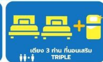
เตียง 3 ท่าน ที่นอนเสริม TRIPLE