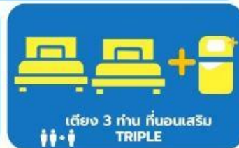
เตียง 3 ท่าน ที่นอนเสริม TRIPLE