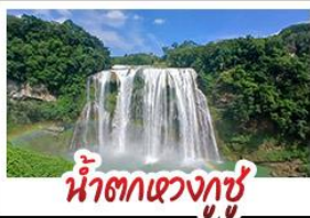
น้ำตกหวงกู่ชู่

สะพานหุบเขาชาวเจียง สะพานแขวนที่ยาวที่สุดในโลก ปราสาทหลงเป่า - หมู่บ้านแม้วเจียงจ่าย กุ้ยหยางชมทุ่งดอกไม้สตาร์ตและดอกซากุระ ล่องเรือทะเลสาบหวิ้นเฟิงหู - น้ำตกหวงกู่ชู่ พักโรงแรมระดับ 4 ดาว - ชมหอเจี้ยวฮิวไหล เมนูปลาต้มซูปเปริยว - ไม่ลงร้านเช้า