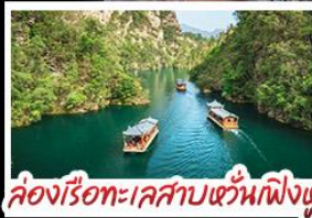
ล่องเรือทะเลสาบหวิ้นเฟิงหู