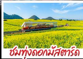
ชมทุ่งดอกไม้สตาร์ต