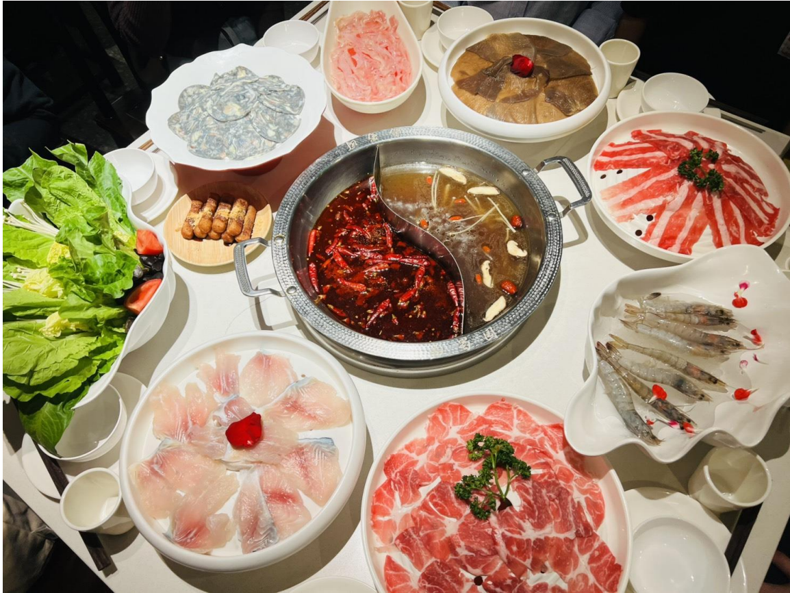
ค่ำ รับประทานอาหารค่ำ ณ ภัตตาคาร (มีที่นั่ง 9) *เมนูพิเศษ สุกี้หมาล่าเสฉวน