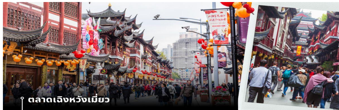
ตลาดเจิ้งหวงเมี่ยว

นำท่านเดินทางสู่ หมู่บ้านโบราณจูเจียเจียว มีฉายาว่า เวนิซตะวันออกแห่งเมืองเซี่ยงไฮ้ เป็นอีกหนึ่งย่านเก่าริมน้ำที่มีชื่อเสียงในเซี่ยงไฮ้ มีประวัติศาสตร์ยาวนานกว่า 1700 ปี ซึ่งพื้นที่ทั้งหมดได้รับการอนุรักษ์ไว้เป็นอย่างดี จุดเด่นของเมืองโบราณแห่งนี้คือพื้นที่ด้านในนั้นมีแม่น้ำหลากหลายสายเชื่อมโยงไปยังพื้นที่ต่างๆ โดยรอบ ทำให้มีบรรยากาศที่สวยงามและร่มรื่น และให้ท่าน ล่องเรือ ชมวิวบ้านเรือนเก่าแก่ริมน้ำ ได้เวลาอันสมควรเดินทางสู่ มหานครเซี่ยงไฮ้ จากนั้นนำท่านสู่ ตลาดโบราณ 100 ปี เฉินหวงเมี่ยว เป็นศูนย์รวมสินค้า และอาหารพื้นเมืองที่แสดงถึงเอกลักษณ์ของชาวเซี่ยงไฮ้ซึ่งมีการผสมผสานระหว่างอดีตและปัจจุบันได้อย่างลงตัว ซึ่งเป็นย่านสินค้าราคาถูกที่มีชื่ออีกย่านหนึ่งของนครเซี่ยงไฮ้ ให้ท่านอิสระช้อปปิ้งตามอัธยาศัย