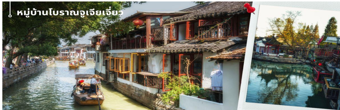
หมู่บ้านโบราณจูเจียเจียว

🍽️ รับประทานอาหารกลางวัน ณ ภัตตาคาร (4) เมนูพิเศษ ชาหลุม้าราย