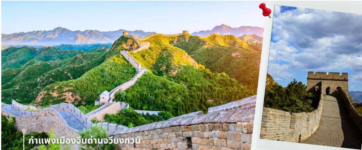
กำแพงเมืองจีนด้านอวิยงกอบ

กรุงปักกิ่งมีการรุกรานจากชนเผ่าเร่ร่อน ด้านจิวหยกวนมีสถาปัตยกรรมที่สวยงามของศิลปะจีน จากยอดด้าน สามารถมองเห็นทิวทัศน์ที่สวยงามของเทือกเขาและธรรมชาติโดยรอบ นับว่าเป็น 1 ใน 8 จุดชมวิวที่มีชื่อเสียงของปักกิ่งมาตั้งแต่สมัยราชวงศ์จิ้น