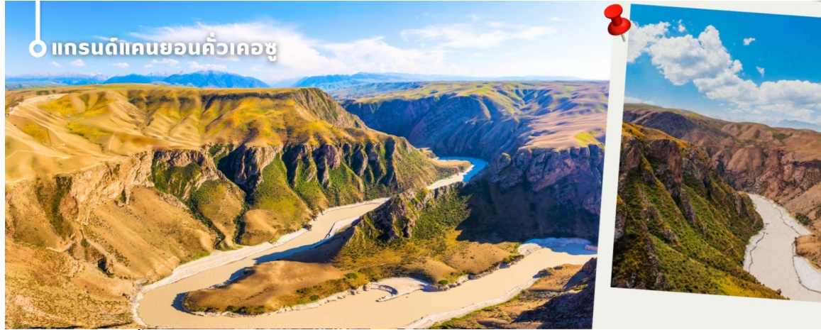
แกรนด์แคนยอนคิ้วเคอซู

จากนั้นนำทุกท่านเดินทางสู่ เมืองเท่อเคอซือ (Tekesi City) หรือ เมืองแปดเหลี่ยม ที่มีชื่อเสียงที่สุดในเขตปกครองตนเองซินเจียงอุยกูร์ เนื่องจากผังเมืองถูกออกแบบเป็นรูปแปดเหลี่ยมตามหลักฮวงจุ้ย ลักษณะคล้ายเขาวงกต โดยมีถนนแผ่กระจายออกจากศูนย์กลางทั้ง 8 ทิศอย่างเป็นระเบียบ ถือเป็นเมืองแปดทิศที่ได้รับการอนุรักษ์ไว้อย่างสมบูรณ์ และมีเอกลักษณ์เพียงแห่งเดียวในโลก ความพิเศษของที่นี่คือ เป็น “เมืองที่ไร้สัญญาณไฟจราจร” โดยในปี ค.ศ. 1996 ได้มีการยกเลิกสัญญาณไฟทั้งหมด แต่การจราจรกลับคล่องตัวอย่างน่าทึ่ง ด้วยผังเมืองที่ออกแบบมาอย่างชาญฉลาด ทำให้รถสามารถสัญจรได้อย่างเป็นระบบโดยแทบไม่เกิดการจราจรติดขัด นอกจากผังเมืองอันโดดเด่นแล้ว ที่นี่ยังเต็มไปด้วยวัฒนธรรมพื้นบ้านที่เข้มข้นและประวัติศาสตร์อันยาวนาน อีกทั้งยังมีแหล่งโบราณคดีสำคัญ เช่น สุสานโบราณชนเผ่าอูซุน (Wusun) ที่ได้รับการอนุรักษ์ไว้อย่างดี ปัจจุบันภาพถ่ายมุมสูงแบบพาโนรามาของเมืองแห่งนี้ได้เผยแพร่ไปทั่วโลก จนกลายเป็นจุดหมายปลายทางในฝันของนักท่องเที่ยวจำนวนมาก