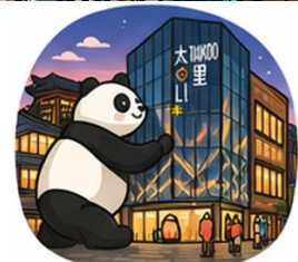
ถนนคนเดินไท่กู่หลี่ (Taikoo Li)

จากนั้นอิสระท่าน ถนนคนเดินชุนซีลู่ ย่านช้อปปิ้งชื่อดังและคึกคักที่สุดของเมือง เต็มไปด้วยห้างสรรพสินค้า ร้านแบรนด์ดัง ร้านอาหาร และสตรีทฟู้ด เหมาะ สำหรับช้อปปิ้งและสัมผัสวิถีชีวิตคนเมือง และ ถนนคนเดินไท่กู่หลี่ แหล่งช้อปปิ้ง ไลฟ์สไตล์สุดทันสมัย ผสมผสานสถาปัตยกรรมจีนโบราณกับดีไซน์โมเดิร์นอย่างลง ตัว รวยล้อมด้วยร้านค้าแบรนด์ดัง คาเฟ่ และมุมถ่ายรูปสวยๆ มากมาย