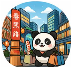
ถนนคนเดินชุนซีลู่ (Chunxi Road)

จากนั้นอิสระท่าน ถนนคนเดินชุนซีลู่ ย่านช้อปปิ้งชื่อดังและคึกคักที่สุดของเมือง เต็มไปด้วยห้างสรรพสินค้า ร้านแบรนด์ดัง ร้านอาหาร และสตรีทฟู้ด เหมาะ สำหรับช้อปปิ้งและสัมผัสวิถีชีวิตคนเมือง และ ถนนคนเดินไท่กู่หลี่ แหล่งช้อปปิ้ง ไลฟ์สไตล์สุดทันสมัย ผสมผสานสถาปัตยกรรมจีนโบราณกับดีไซน์โมเดิร์นอย่างลง ตัว รวยล้อมด้วยร้านค้าแบรนด์ดัง คาเฟ่ และมุมถ่ายรูปสวยๆ มากมาย