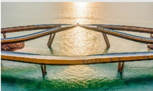
สะพานจวบ