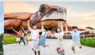
วินเพิร์ล อควาเรียม

*ทางบริษัทฯ ขอสงวนสิทธิ์ในการสลับโปรแกรมทัวร์ตามความเหมาะสมขึ้นอยู่กับสถานการณ์หน้างาน โดยคำนึงถึงผลประโยชน์ของลูกค้าเป็นสำคัญ