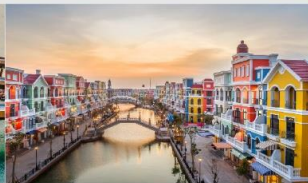
แกรนด์เวิลด์ฟู้ทิวค