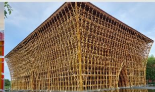
บ้านไม้ไฟ